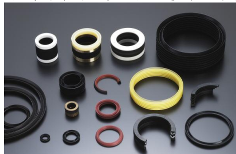
シリコーンゴムインサート成型