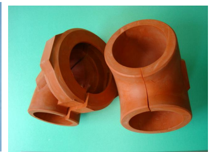
プレス成型スポンジ