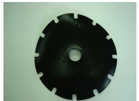
シリコーンゴム-テフロン