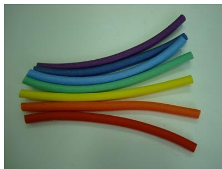
着色したスポンジ