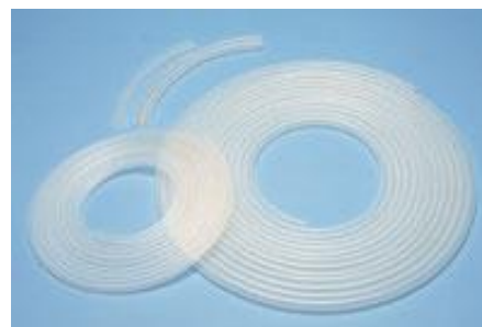
食品用シリコーンゴムチューブ