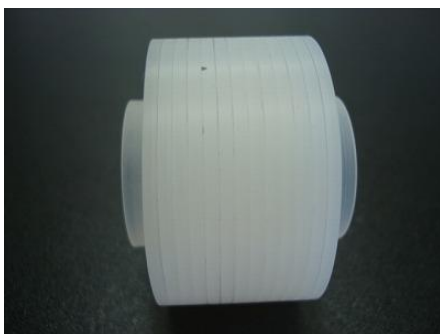
機械加工品ジャバラ